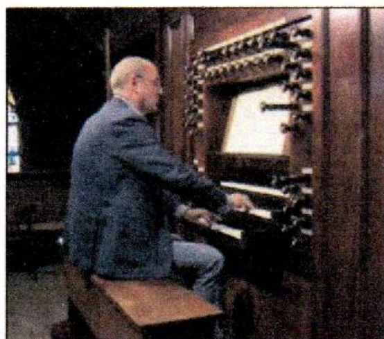
Sint Jozefkoor en Robustelly-orgel | F Sint Jozefkoor

Vanwege het Robustelly-orgel dat een prominente rol vervult bij het eerstkomende weer totaantal andere concert, verhuist het Sint Jozefkoor